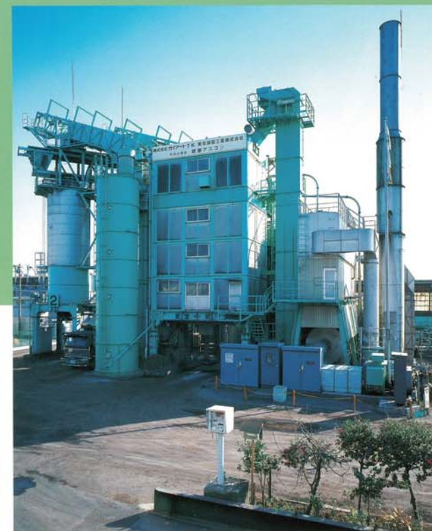
バージン/再生プラント本体