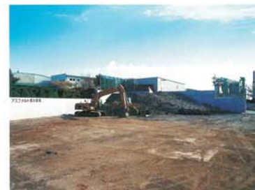
アスファルト廃材置場

名 称：共同企業体綾瀬アスコン 構 成 員：(株)ガイアートT・K / 東京舗装工業(株) 共同企業体 所 在 地：神奈川県綾瀬市小園806 敷地面積：11335㎡