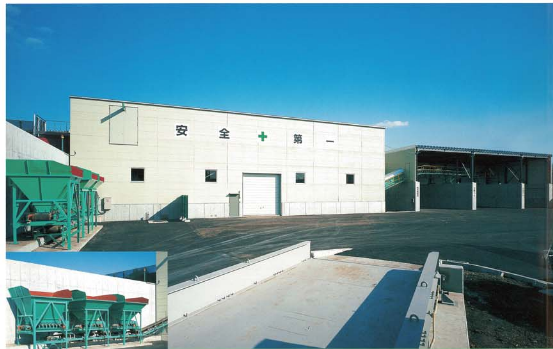
新設破碎プラント 各々の廃材を破碎して、分級材（20-13、13-0mm）・再生路盤材（40-0mm）を生産し、併せてアスガラ及びコンクリートガラの受入れ、再生路盤材の販売も行います。